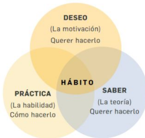
Gráfico 5. Cómo formar hábitos con efectividad.